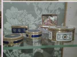
MUSEE DES ARTS DECORATIFS : EXPOSITION DIOR