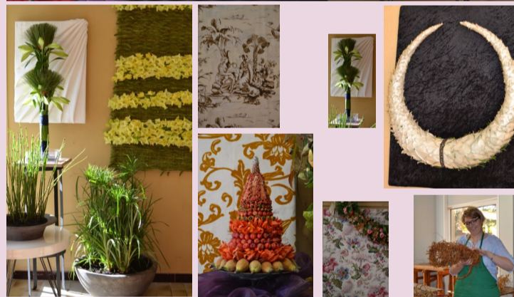
L'évolution de l'ornement floral à travers les siècles.